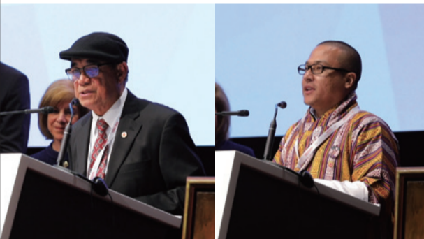
新たに国際赤十字・赤新月社連盟に加盟した、マーシャル諸島共和国の赤十字社社長(左)とブータン王国の赤十字社事務総長(右)

12月、スイスのジュネーブで2年に1度開かれる連盟総会、赤十字代表者会議が開催されました。世界で起きている災害や紛争などの問題についてさまざまな議論が交わされましたが、中でも大きなテーマの1つとして取り上げられたのは、世界各地に被害をもた