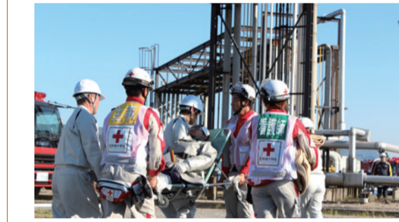
コンビナートでの訓練で負傷者の搬送手順を確認し合う参加者たち

11月6日、日赤香川県支部は「香川県石油コンビナート総合防災訓練」に参加しました。大規模地震による火災を想定し、救護班の派遣や医療機関への搬送など、災害発生時の救護態勢を確認。それに続く11月9～10日には「日本赤十字社中国四国ブロック各県支部合同災害救護訓練」も実施。9県の日赤支部と赤十字病院、関係機関がさらなる連携強化を図っています。