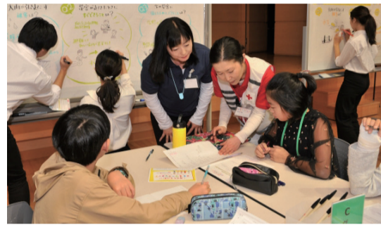
「災害に強い食物を作る品種改良」など大人顔負けのアイデアも

12月1日、日赤主催の「海外たすけあい こどもワークショップ」が日本赤十字看護大学で開かれました。世界各地で発生している気候変動による人道危機を子どもたちが学び、解決策を探っていく取り組みです。異常気象による影響を受けるルワンダを取り上げ、「ルワンダの人たちのために何ができるか？」というテーマで、子どもたち自身がアイデアを発表しました。