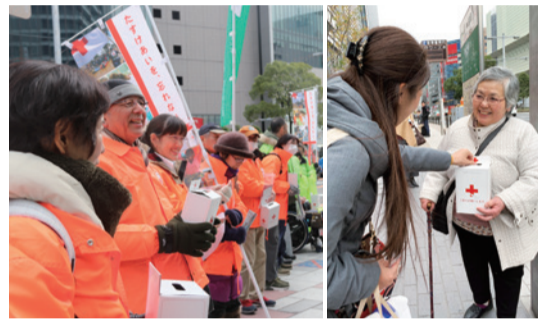
赤十字奉仕団員が道行く人たちに支援を呼び掛けた(愛知県)

日赤とNHKが共同で実施している「NHK海外たすけあいキャンペーン」の街頭募金が各地で行われました。毎年恒例のこのキャンペーンでは、これまでに世界157の国と地域を支援。37回目となる今回も、全国各地で赤十字奉仕団員が募金を呼びかけ、紛争や災害、病気といった人道危機により苦しむ世界の人々への温かい支援を募りました。