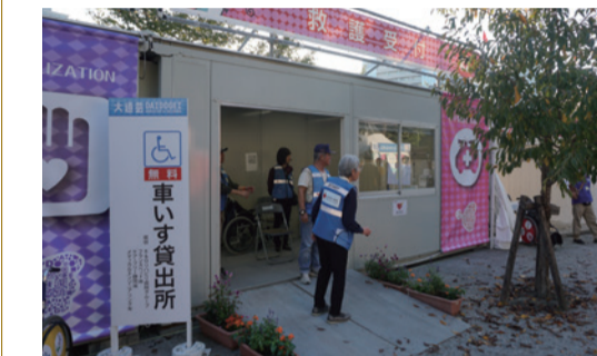
約60人の奉仕団員が協力し、4日間で70人の傷病者を手当てした

11月1～4日にかけて開催された「大道芸ワールドカップ in 静岡2019」で、日赤静岡県支部の赤十字安全奉仕団と看護奉仕団が救護ボランティアの活動を行いました。同大会での活動は28年目を数えますが、昨年より29万人多い172万人もの人々が来場。奉仕団員は救護ブースを増設し、大道芸パフォーマンスを楽しむ来場者の健康と安全、そして笑顔を守るために尽力しました。