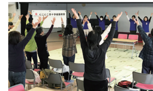
血圧を測定し準備体操からスタート。昼食は赤十字奉仕団の手料理!

日赤長野県支部は県内各地で「にこにこ赤十字健康教室」を開催しています。初開催は25年前。ニーズに合わせて内容を発展させていき、現在は65歳以上の高齢者向けに、認知症や寝たきりを予防する内容も取り入れています。元気に長生きするための秘訣を学んだ参加者からは「寒くても引きこもってちゃダメね。いつまでも元気でいます！」との声も聞かれました。