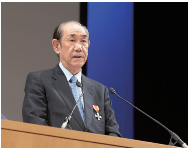
社長として全国各地の赤十字大会で登壇（写真は富山県支部創立130周年記念大会）