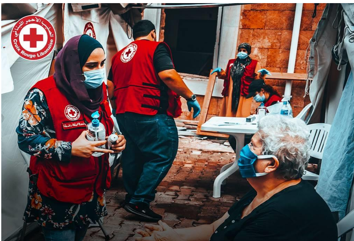
被災者のこころのケアを行う赤十字ボランティア

日本赤十字社は 8 月 7 日に開始した「中東人道危機救援金（レバノン爆発）」について、現地の支援ニーズに対応するため 受付期間を 10 月 31 日まで延長 いたします。引き続き、皆さまからの温かいご支援をお願いいたします。