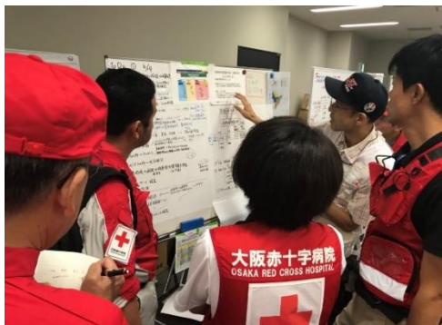
大阪府保健医療調整本部に入った救護班①