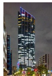
虎ノ門ヒルズ(東京)