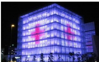
阪神・淡路大震災「人と防災未来センター」(兵庫)

5 月 8 日は、世界赤十字デーです。赤十字の創始者アンリー・デュナン生誕の日にちなみ、1948 年に制定されました。日本赤十字社では、紛争や災害で苦しむ人々に寄り添い、デュナンが強く訴えた「人道」への理解を深めていただくことを目的として、この日を中心に「レッドライトアッププロジェクト 2017」を実施いたします。5 月上旬には、国内の歴史的建造物やランドマークとなる施設、企業さまなどにご参加をいただき、全国を赤い色で彩ります。(全国 35 施設で実施予定)