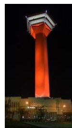
五稜郭タワー(北海道)