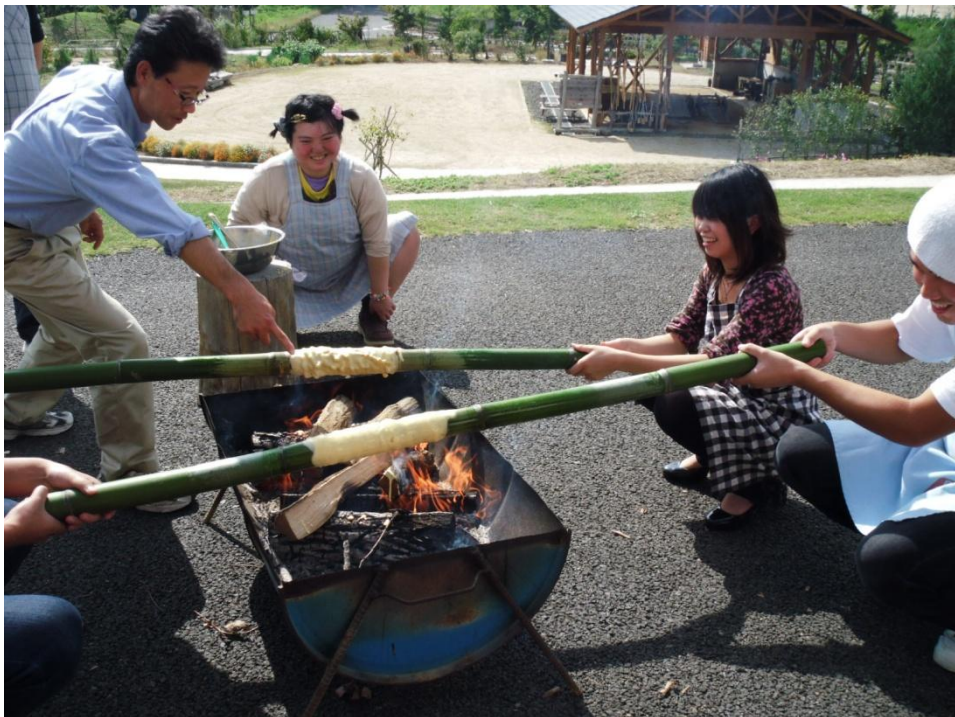
自閉症グループでの活動