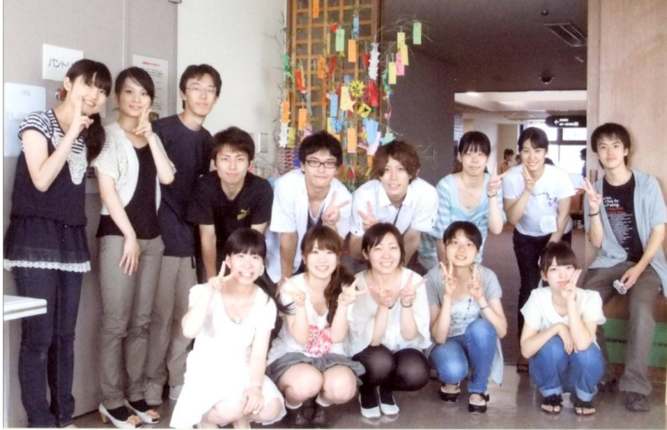
小児科訪問グループでの七夕の会