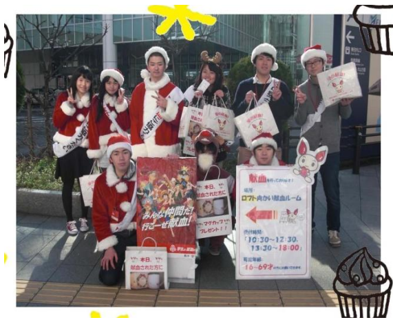
学生ボランティアの方々と献血合同呼びかけ