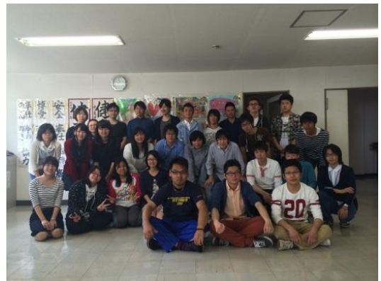
岐阜青奉・中部学院のみなさんと共に活動しています。