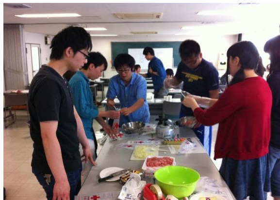
ハイゼックスの活動風景