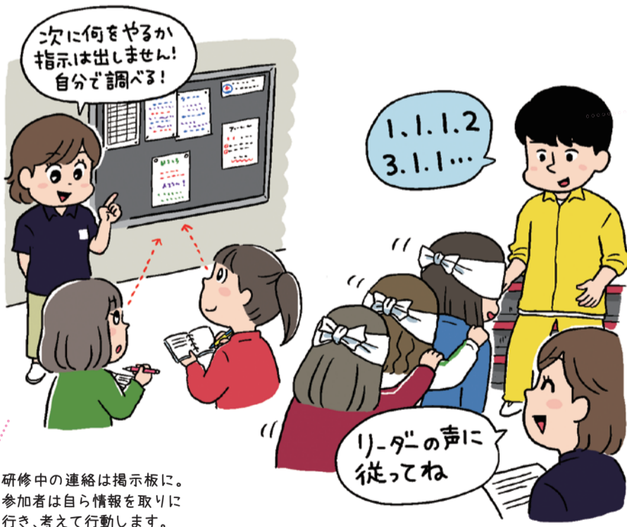
研修中の連絡は掲示板に。参加者は自ら情報を取りに行き、考えて行動します。

チーム全員で協力し合う心を育てます。誘導役は危険を避けることを最優先に、目隠しをしたメンバーに「1=前進」「2=止まれ」「3=右曲がる」「4=左曲がる」のみ伝えます。