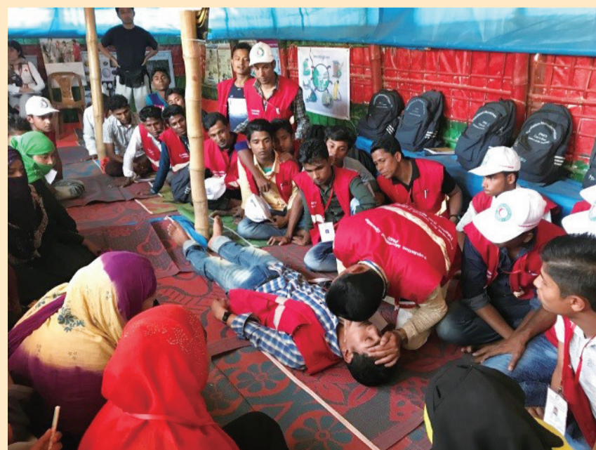
ボランティアもほとんどが避難民。研修内容は、救急法やこころのケアなど多岐にわたる

※国際赤十字では、政治的・民族的背景および避難されている方々の多様性に配慮し、「ロヒンギャ」という表現をしないこととしています。