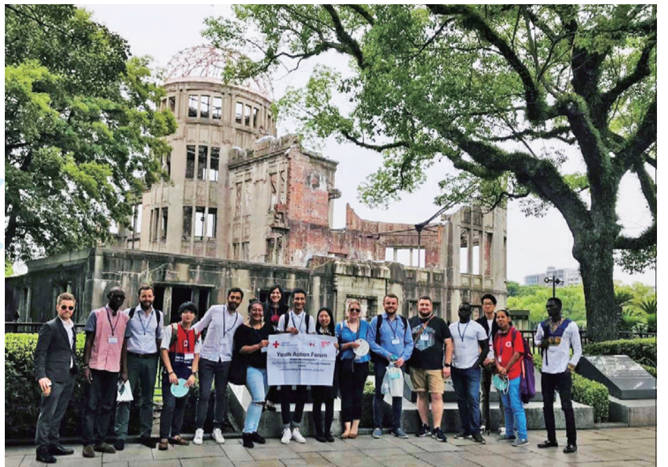
広島原爆ドームを訪れたユースの一行。平和記念公園では献花も行った

必要な50カ国での批准にはいまだ届いていないのが実情です。今回のフォーラムは、核兵器廃絶の実現に向けて、未来を担う次世代に被爆者たちの体験を継承していく、という大切な役割を果たしました。最終日のプログラムを終えたユースメンバーたちは核兵器廃絶を誓う声明をまとめ上げ、SNSを活用するキャンペーンなど若い世代ならではの施策を提案。「フォーラムで得た教訓を母国へ帰っていかにつなげていくか、そして問題意識を持ち続け、行動を起こしていくかが大事」と口々に語りながら帰国の途につきました。