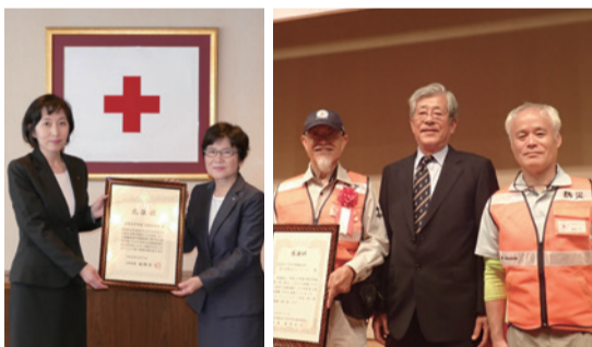
(左)市の担当者と府支部事務局長、(右)社会福祉協議会長と防災ボラ

6月18日、茨木市から日赤大阪府支部に、茨木市社会福祉協議会から赤十字防災ボランティアに、それぞれに感謝状が贈呈されました。大阪府支部は発災直後の1週間で延べ60人の医療救護員を派遣し、地元の保健師とともに避難所アセスメントを実施。また、赤十字防災ボランティアは延べ55人が27日間にわたり災害ボランティアセンターの運営を支援しました。