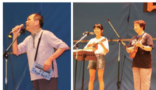
(左)点字を読みながら熱唱(右)視覚障害者と聴覚者のウクレレ合奏

6月8日、日赤が運営する視覚障害者のための福祉施設・神奈川県ライトセンターで「第10回ライトセンター音楽祭」が開催されました。ステージに立ったのは音楽を愛する視覚障害者とその仲間たち。チェロ、大正琴、ウクレレ、ピアノ、コーラスなど、バラエティに富んだ楽器演奏と歌声はこの日のために磨き上げたもの。会場は温かな思いと熱い音楽に満たされました。