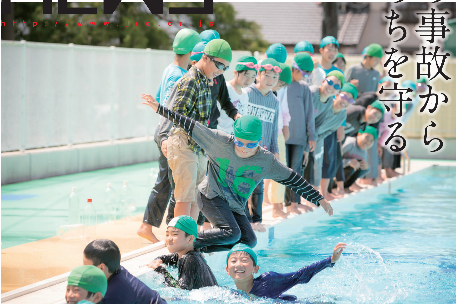
日赤佐賀県支部 JRC 加盟校 神崎市立千代田西部小学校での水上安全法講習