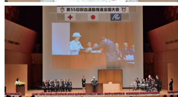
名誉副総裁から、各賞の受賞者に表彰状が授与された