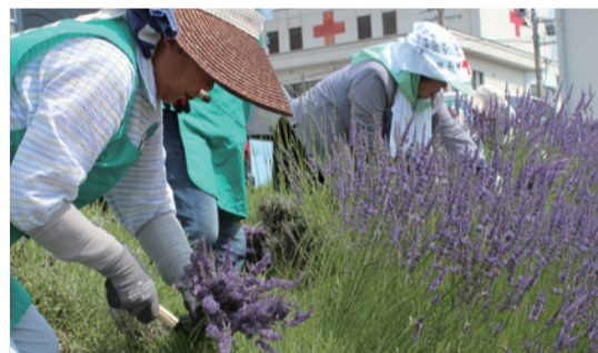
たくさんの花を咲かせたラベンダーを奉仕団員が丁寧に摘み取った

7月3日、日赤長野支部の松川町赤十字奉仕団が下伊那赤十字病院を訪問。入院患者のみなさんに手作りのラベンダーポプリを贈りました。このポプリのラベンダーは、10年ほど前に近隣の方から同院へ寄贈され、病院職員が苗を増やしてきたもの。初夏の訪れとともに花盛りとなるラベンダーを奉仕団員が摘み取り、すぐに袋詰め。爽やかな癒やしの香りを届けました。