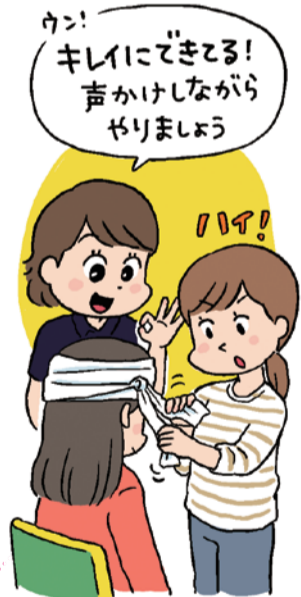
三角きんを使った応急手当てなどを学びます。

チーム全員で協力し合う心を育てます。誘導役は危険を避けることを最優先に、目隠しをしたメンバーに「1=前進」「2=止まれ」「3=右曲がる」「4=左曲がる」のみ伝えます。