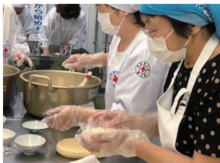
日頃から取り組んでいる訓練を生かして300個のおにぎりを配布

6月20日に永平寺町で発生した繊維工場の火災に際して、日赤福井県支部の永平寺町赤十字奉仕団は、消火活動などにあたる消防団員や従業員らのためにおにぎりを配布しました。火災発生後、町役場が付近の住民に避難を呼びかける中、16人の団員が「苦しんでいる人を救いたい」という思いを胸に集結し、いち早く炊き出しを行いました。