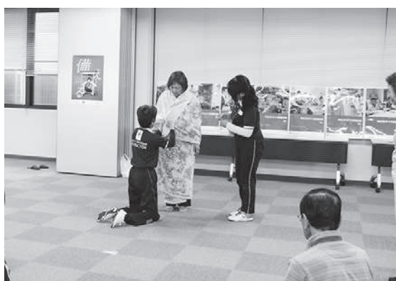
毛布を活用したガウンの実演