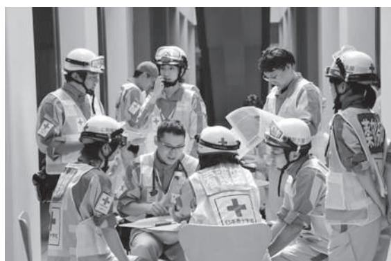
救護員実践研修会