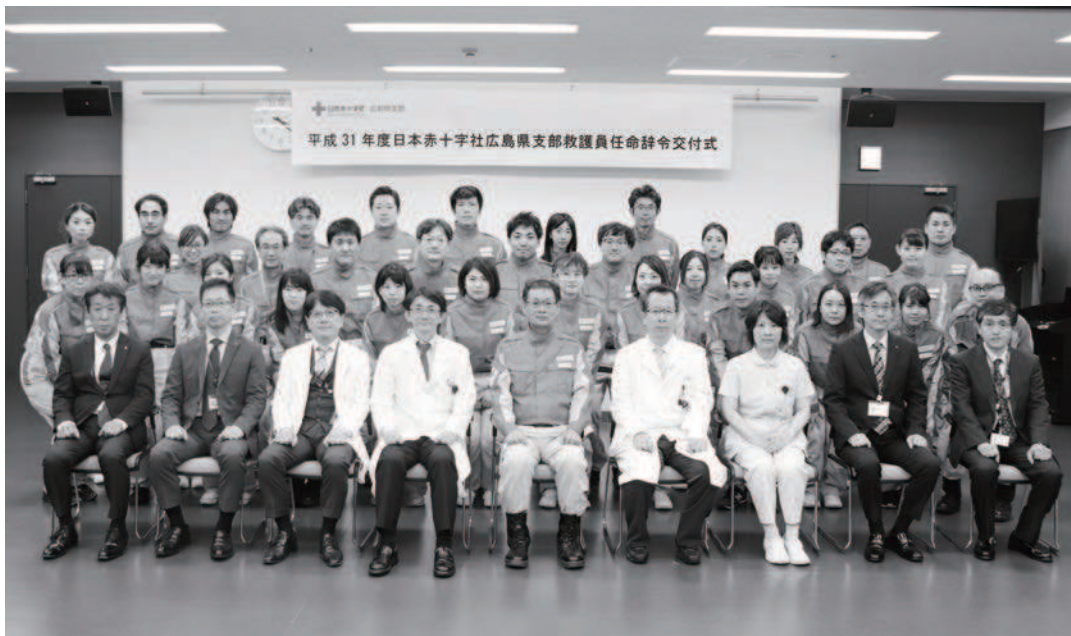
広島市内赤十字施設の救護員