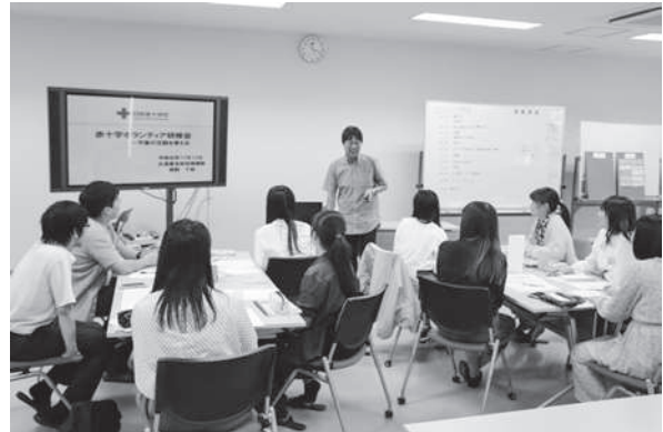
広島県青年赤十字奉仕団ボランティア研修会