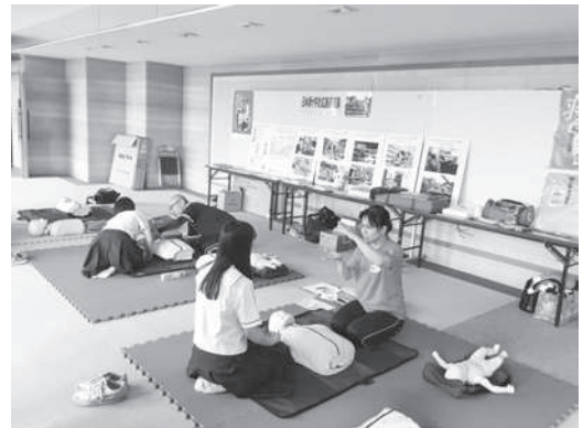
救急法のミニ講習