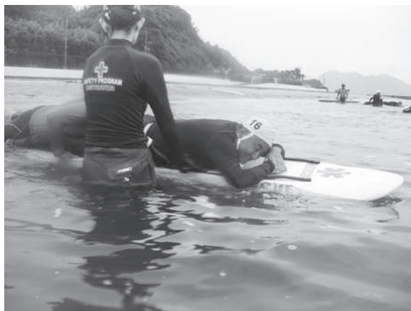
レスキューボードを使った救助