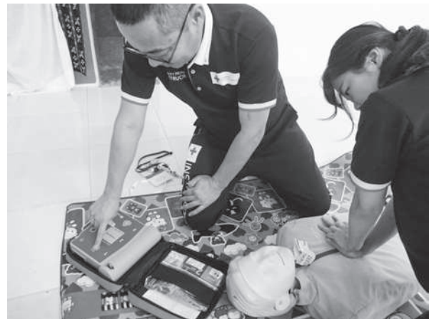
デモンストレーションを行う日赤職員