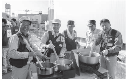
奉仕団による炊き出しグルメフェスタ