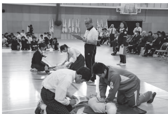
分科会(高等学校/救急法競技大会)