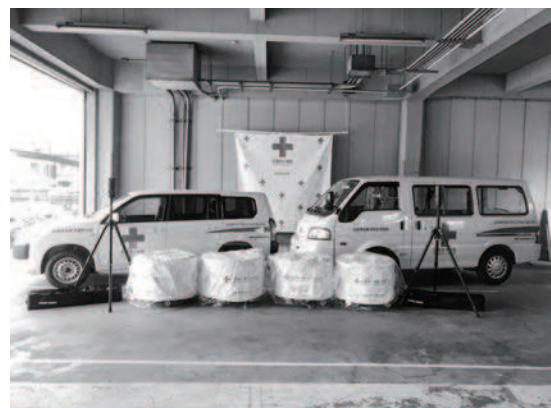
地区・分区に整備された車両、炊出し釜と支部に寄贈されたLED投光機 (贈 協和鉱業株式会社)