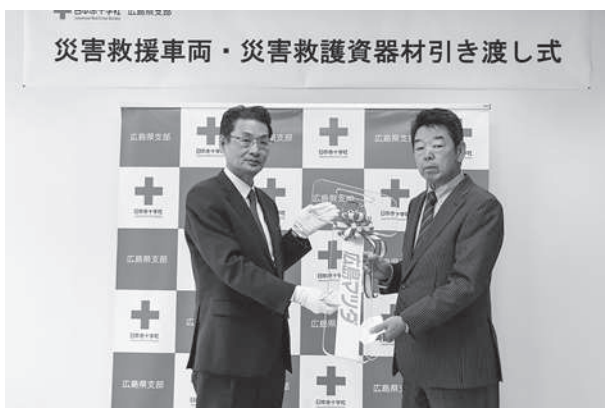
車両の引き渡し式 (贈 協和鉱業株式会社)