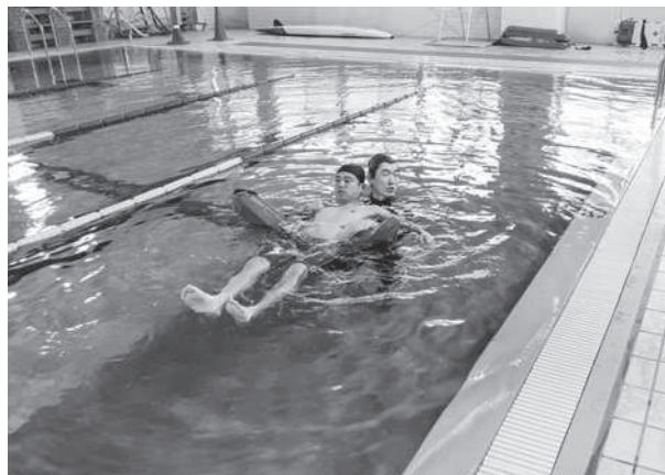
レスキューチューブを使った救助