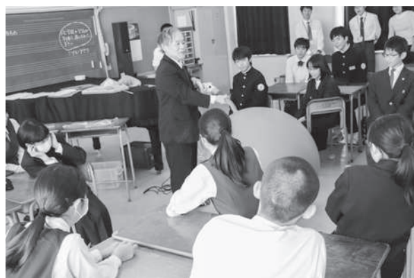
分科会(中学校/グループワーク)