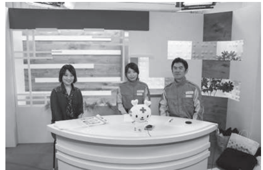
三原テレビ放送に出演した支部職員