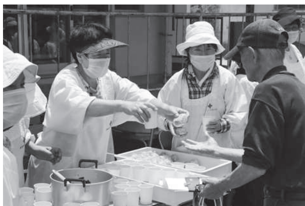
防災訓練での炊き出し（呉市赤十字奉仕団）

地域赤十字奉仕団は、各地域における赤十字事業を第一線で支えるボランティア組織として、主に市町単位に組織され、活動資金募集活動や赤十字思想の普及活動に取り組むほか、高齢者支援活動（給食サービス・友愛訪問等）、社会福祉施設の訪問や地域福祉活動等のそれぞれの地域のニーズに応じた活動を展開しました。