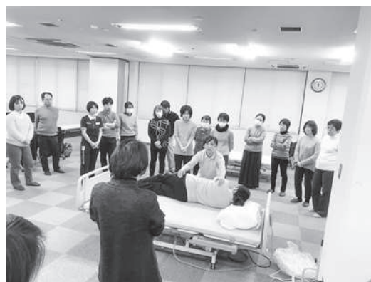
ベッド上での体位変換