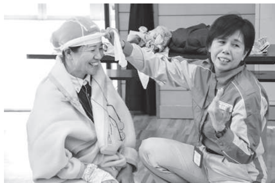
身近なものをを用いた応急手当