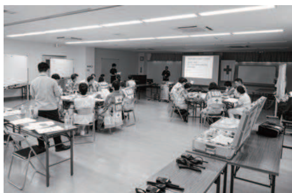
救護員研修(基礎研修)