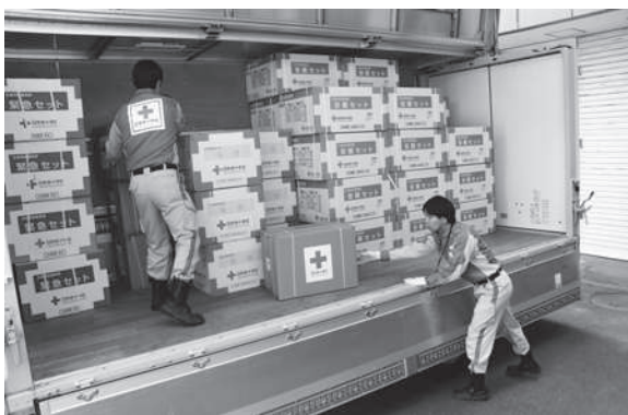
救援物資を積み込む職員

2月27日夜に尾道市因島土生町で発生した火災により、被害を受けた住民の生活支援のため、28日に支部職員2名が救援物資（毛布150枚、緊急セット48組、安眠セット150組、大人用寝衣96着、子供用寝衣60着、タオル3点セット150組）を尾道市因島総合支所に搬送しました。