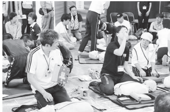
一次救命処置（心肺蘇生とAED）