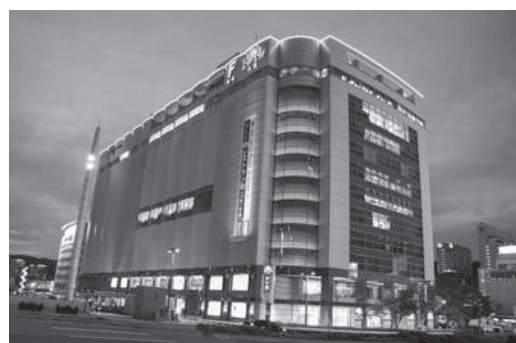
赤くライトアップされたエールエールA館