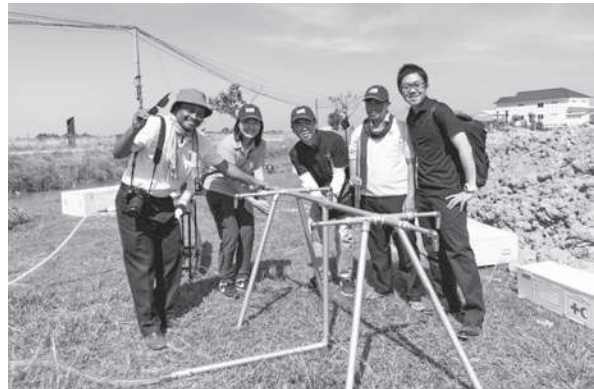
給水キットのデモンストレーション