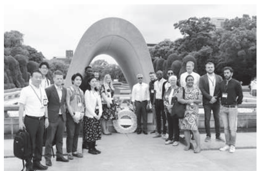
ユースアクションフォーラムの参加者