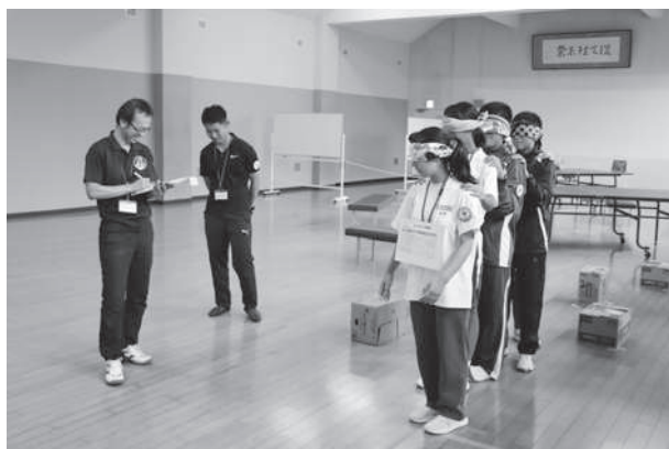
中学生によるフィールドワーク