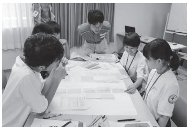
高校生による災害エスノグラフィー演習