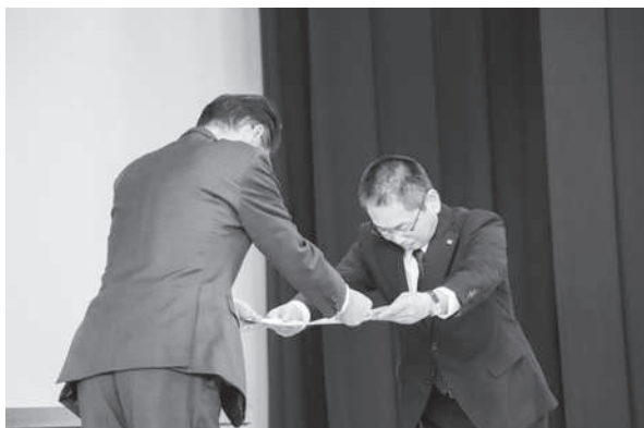
永年加盟表彰状の授与