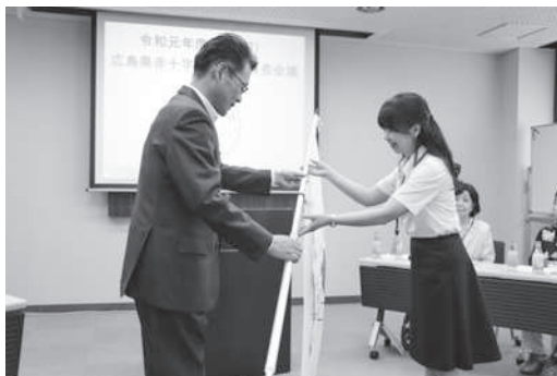
新奉仕団への団旗授与（健康・栄養赤十字奉仕団）

また、5月には被災者の健康・維持・向上を目指す「健康・栄養赤十字奉仕団」が結成され、仮設住宅で炊き出しや栄養相談・健康教室などを行いました。