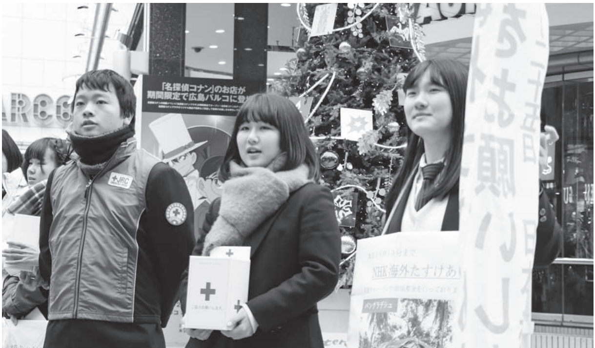
青少年赤十字メンバーによる街頭募金