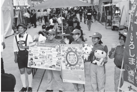
青年赤十字奉仕団によるメディア出演

青年赤十字奉仕団は、県内の大学・短期大学等の学生や社会人によって組織されており、社会福祉施設への定期訪問や若年層を中心にした献血推進活動、義援金募集活動等に取り組みました。