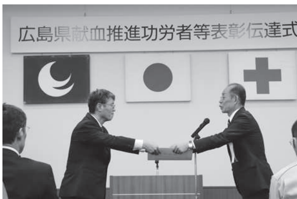
献血推進功労者に対して感謝状を贈呈

この運動の一環として、7月30日に広島県・支部・広島県赤十字血液センターの共催で「令和元年度広島県献血推進功労者等表彰伝達式-献血感謝のつどい」を開催し、35団体と20名の個人を表彰するとともに、県内の中・高等学校から募集した献血推進ポスター361点の中から入選作品16点を表彰しました。