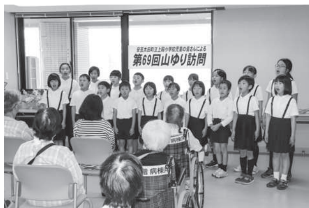
安芸太田町立上殿小学校による「やまゆり訪問」