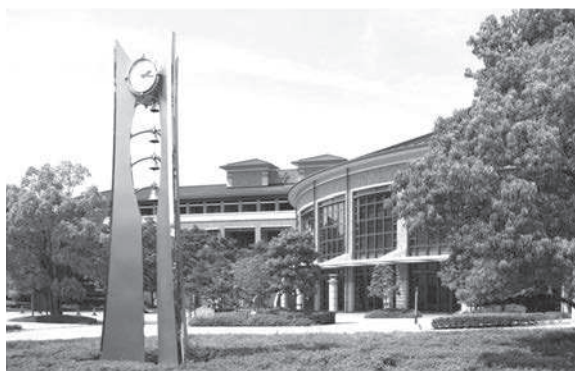
日本赤十字広島看護大学

日本赤十字広島看護大学は、赤十字の中国・四国ブロックにおける拠点校として、国内外の保健・医療・福祉の分野をはじめ、災害救護や国際救援、教育・研究現場等様々な場において活躍できる看護師等の養成を行っています。