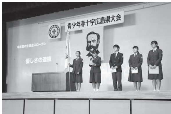
各校による活動発表