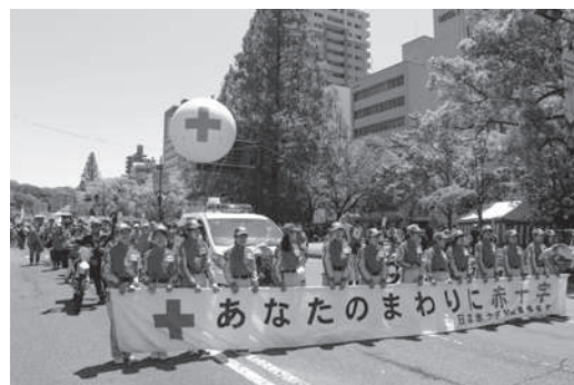
平和大通りでのパレード