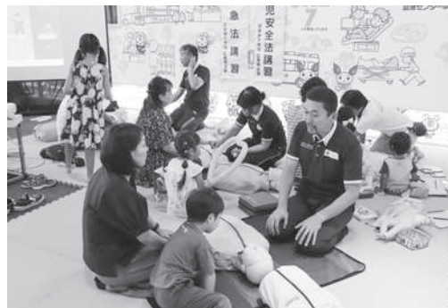
安全赤十字奉仕団による救急法講習