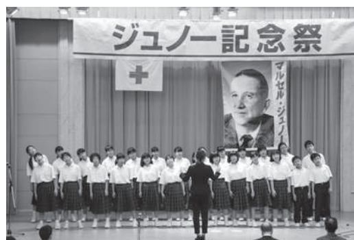
府中緑ヶ丘中学校吹奏楽部による合唱