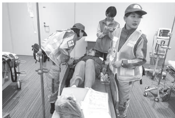
第5ブロック合同災害救護訓練