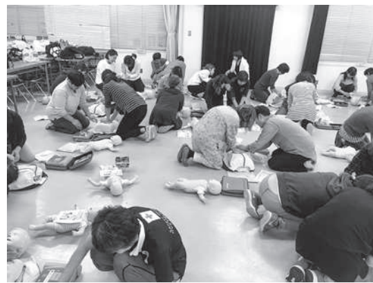
乳幼児に対する心肺蘇生