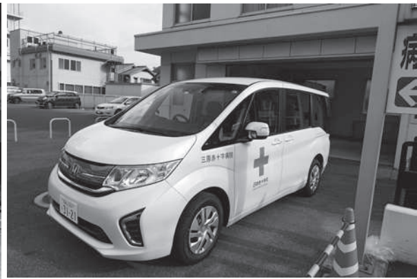
災害救援車(三原赤十字病院)