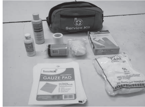
国際活動資金により整備された救急キット