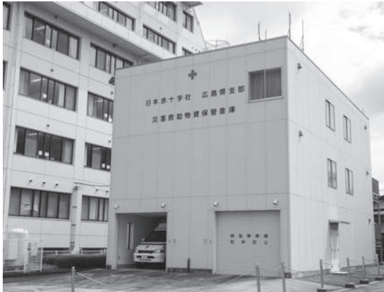
災害救助物資保管倉庫（庄原赤十字病院）