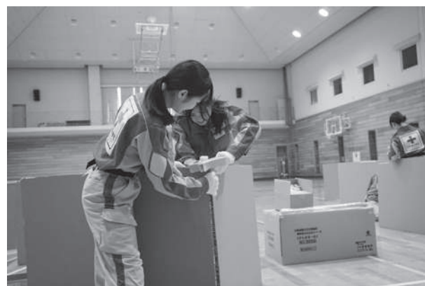
授業風景 (災害看護学)