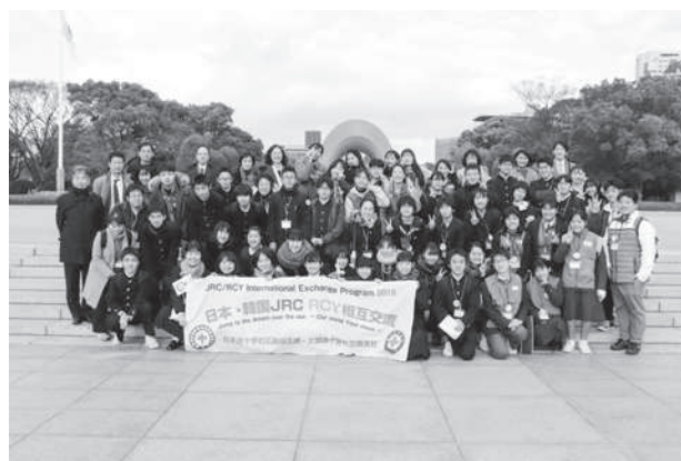
広島平和記念公園の見学（受入）