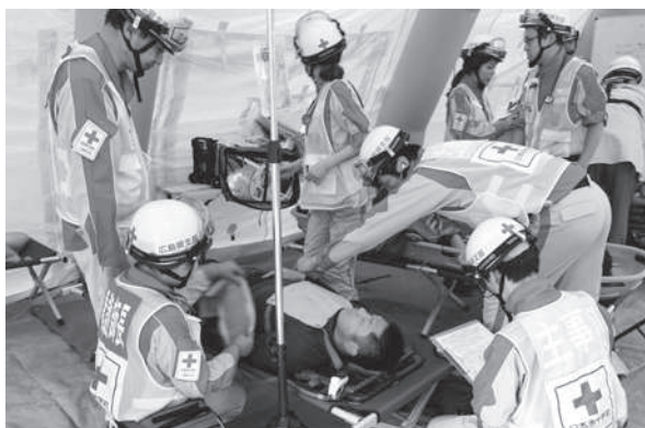
広島市総合防災訓練