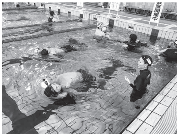
救助用器材を用いない救助