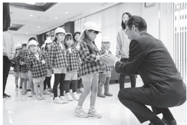
初神保育園の園児たち