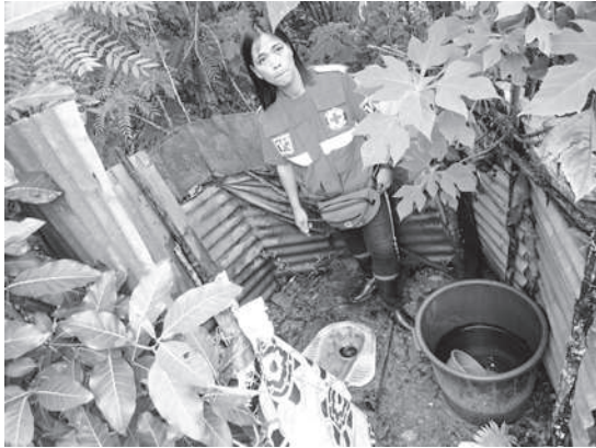
衛生環境を調査する現地赤十字職員