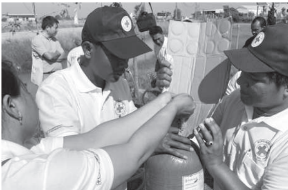
給水キットを組み立てる現地スタッフ

また、12 月 8 日から 12 月 15 日にかけて、この事業を視察するため、支援国の 1 つであるカンボジア王国に支部職員 1 名を派遣しました。