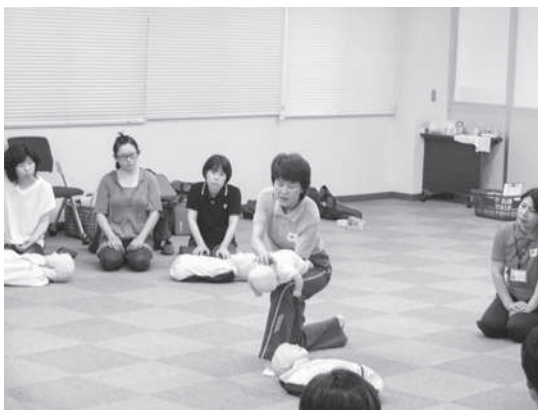
背部叩打法による気道異物除去