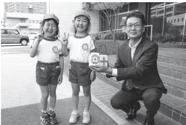
くまの中央保育園の園児たち