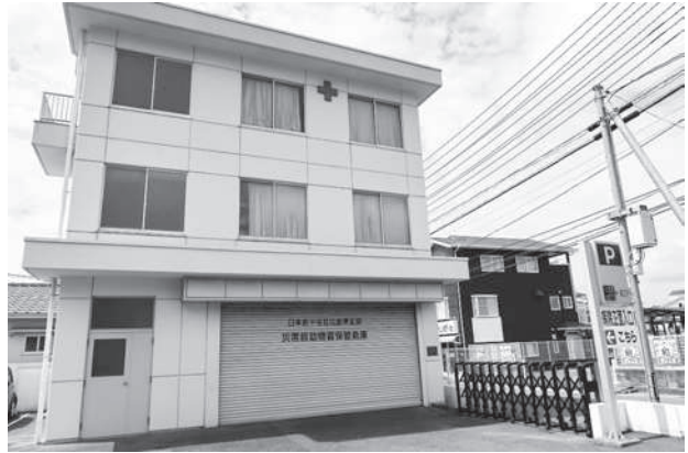
災害救助物資保管倉庫（三原赤十字病院）