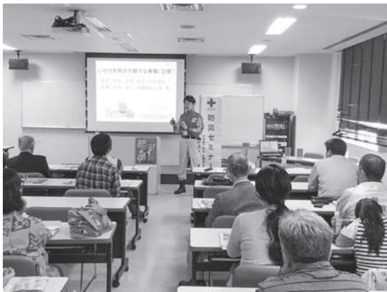
災害への備え（講義）