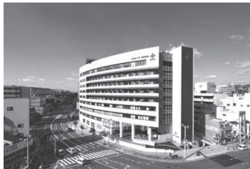
広島赤十字・原爆病院

そのほか、低侵襲手術支援ロボット da VinciXを導入し、最先端の医療提供体制を整えました。