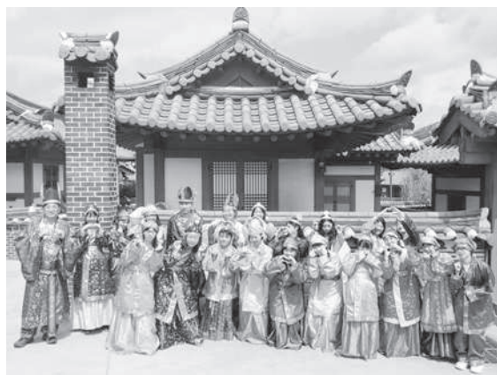
慶北宮にて民族衣装を着ての異文化体験（派遣）