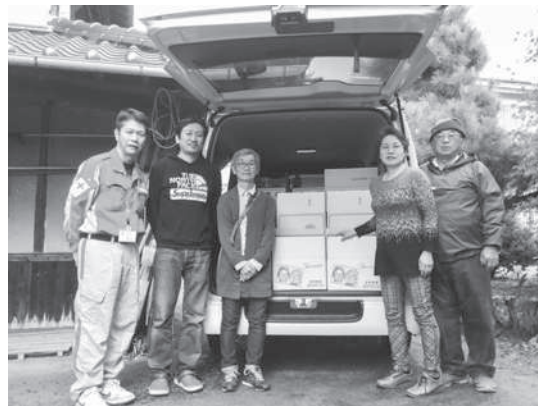
収穫したみかんを被災地へ （瀬戸田町さくら赤十字奉仕団）