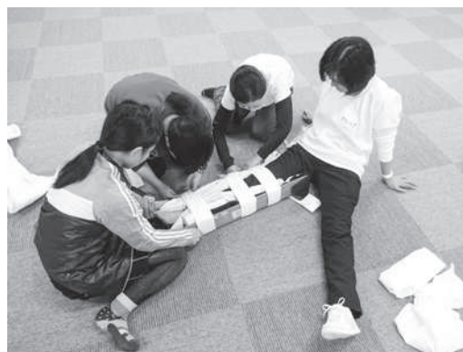
骨折（下腿）の手当の実技