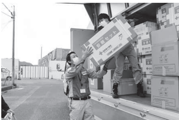
現地にて救援物資を搬入する職員