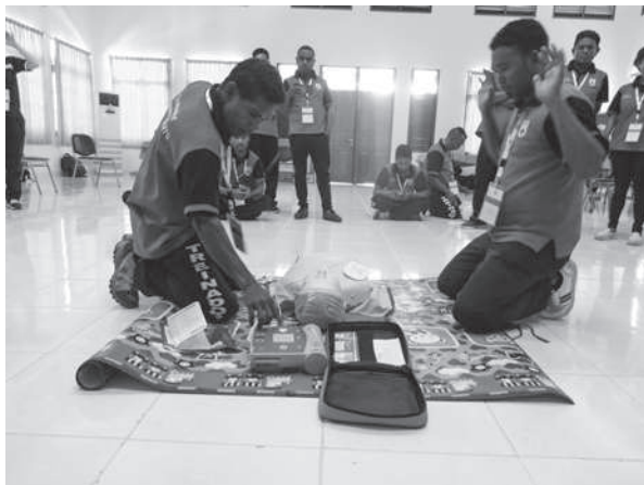
心肺蘇生のトレーニングを行う現地指導員

10月19日から27日にかけて、東ティモール赤十字社への救急法等普及支援事業のため、支部職員1名を東ティモール民主共和国に派遣し、同赤十字社が開催する現地指導員対象の救急法指導員研修会にて心肺蘇生などの指導方法や講習の普及方法について助言しました。