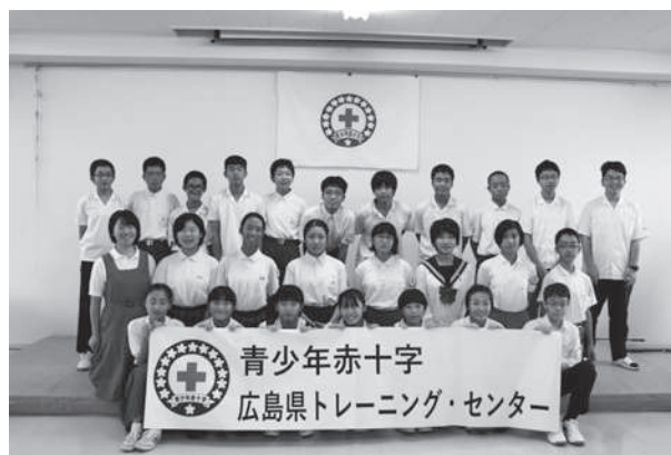
青少年赤十字広島県リーダーシップ・トレーニング・センター