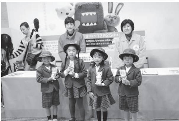
手作りの募金箱を持参する園児