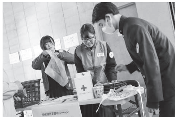
青少年赤十字メンバーによる支援バザー