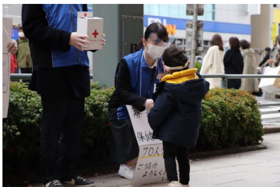
青少年赤十字メンバーによる街頭募金