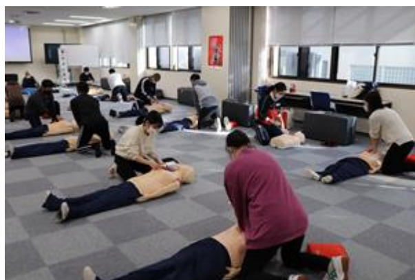
感染防止対策を講じながらの実技演習

新型コロナウイルス感染症の感染防止の観点から、受講者及び指導員の安全を確保するため、人工呼吸や人と人が接触する実技、3つの密が避けられないグループワーク等は実施できませんでしたが、実施できない内容については動画等を用いて説明を行いました。