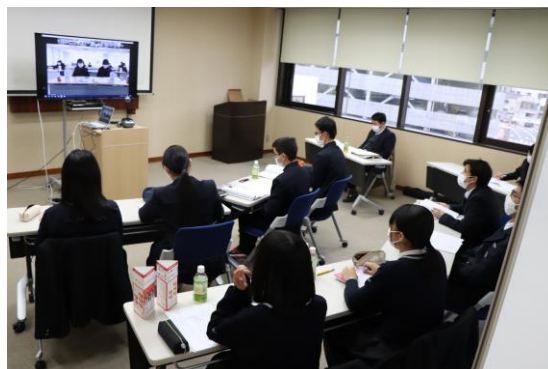
他県の高校生と意見交換する生徒たち

令和2年度は、新型コロナウイルス感染症の影響により、WEBによる研修（スタディ・プログラム）として開催され、本県からは、県内の高校生の代表として、青少年赤十字広島県高等学校協議会の役員生徒8名が参加しました。