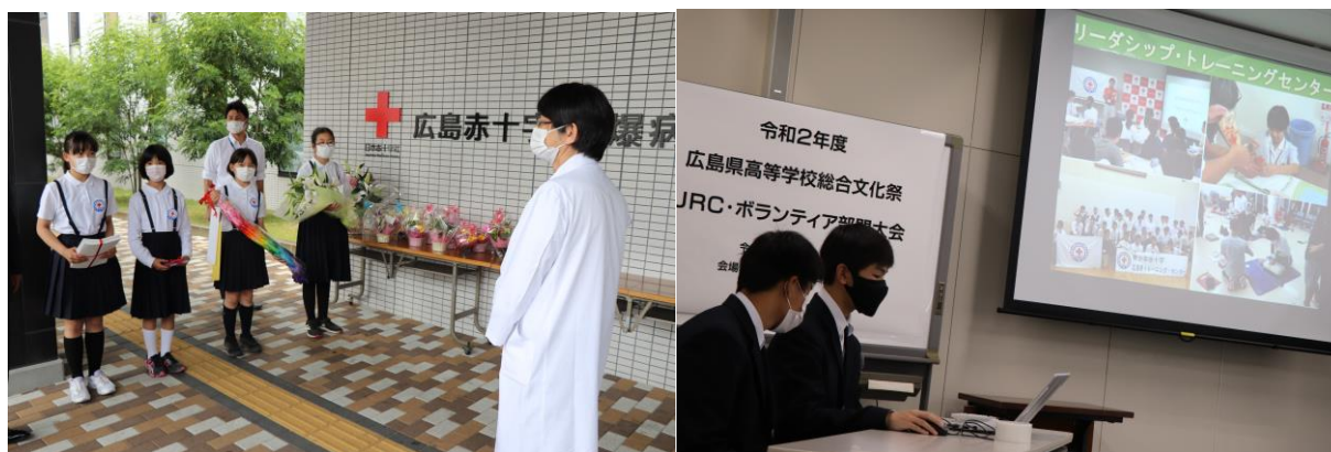
安芸太田町立上殿小学校による「やまゆり訪問」