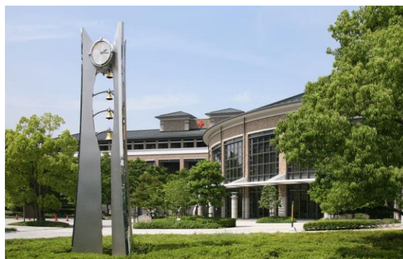
日本赤十字広島看護大学

日本赤十字広島看護大学は、赤十字の中国・四国ブロックにおける拠点校として、国内外の保健・医療・福祉の分野をはじめ、災害救護や国際救援、教育・研究現場等様々な場において活躍できる看護師等の養成を行っています。