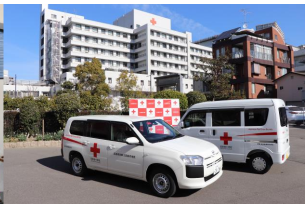
地区・分区に整備された車両 (贈 協和鋳業株式会社)