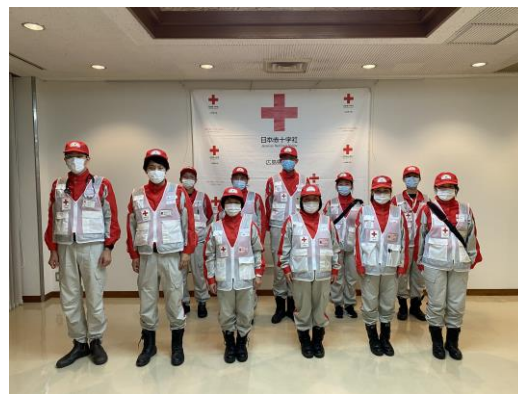
活動を終え支部に帰着した救護班