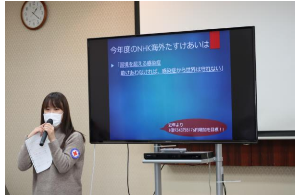
広島県青年赤十字奉仕団ボランティア研修会