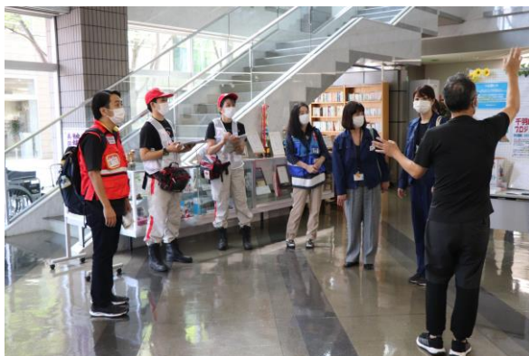
避難所アセスメントの様子（安芸郡坂町）