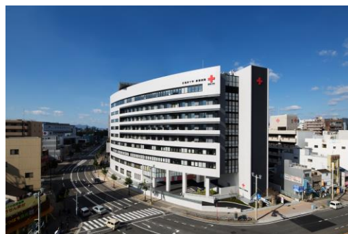
広島赤十字・原爆病院

広島赤十字・原爆病院は、地域の中核病院として通常医療を継続しつつ、広島県や広島市などの要請に基づき、新型コロナウイルス感染症への様々な対応を行いました。