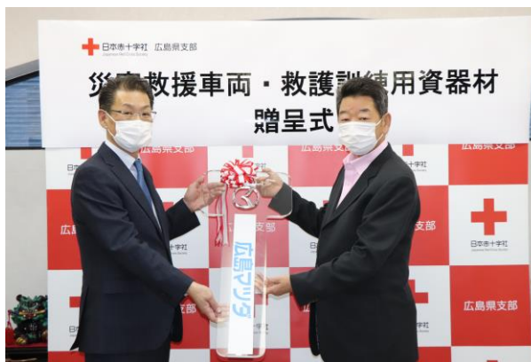
車両等の引き渡し式 (贈 協和鋳業株式会社)