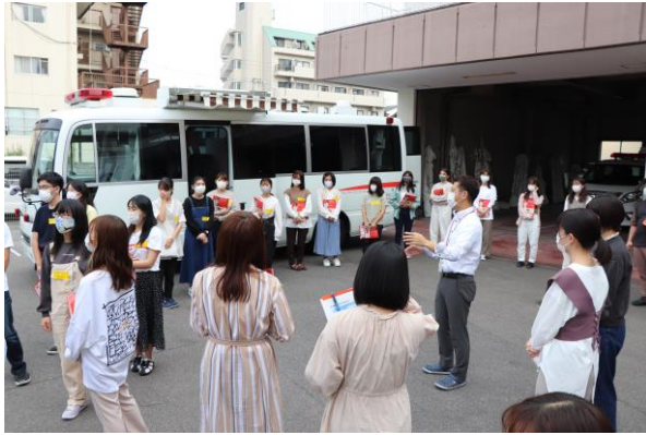
広島青年赤十字奉仕団新入団員研修会