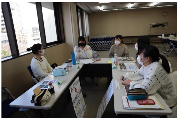
広島県青年赤十字奉仕団ボランティア研修会

その他、NHK海外たすけあいキャンペーンでは、新型コロナウイルス感染症への感染対策を施した上で、街頭募金と支援バザーを実施しました。