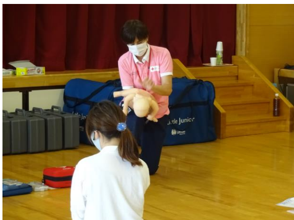
背部叩打法による気道異物除去