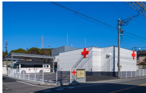
広島県赤十字血液センター 福山出張所

新たな福山出張所には、地域の皆さまに献血セミナーや研修等にご利用いただける多目的室も整備し、地域に開かれた施設となっています。