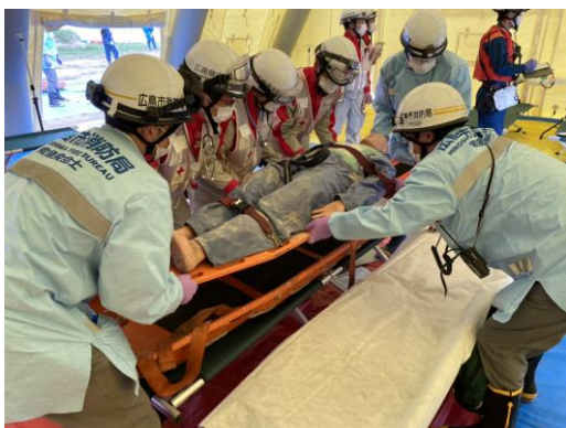
救護所での応急手当