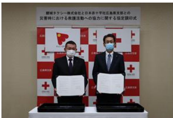
災害時における救護活動への協力に関する協定調印式

この協定により、今後発災が想定される南海トラフ地震等の広域にわたる甚大な被害が想定される災害において、救護班等を迅速・確実に被災地へ輸送できるよう鯉城タクシー株式会社から大型バス等の車両や運転操作員を提供いただき、現地での円滑な救護活動が行えることとなります。