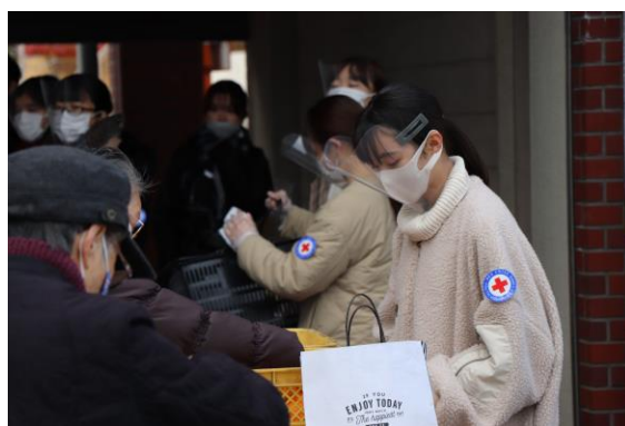
青年赤十字奉仕団メンバーによる支援バザー