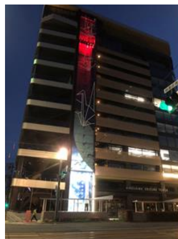
赤くライトアップされたおりづるタワー