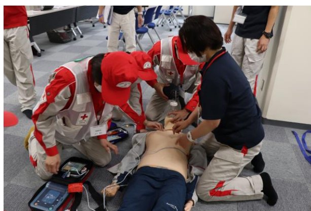
救護員実践研修会