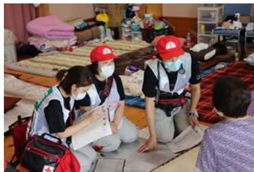
巡回診療の様子（熊本県葦北郡芦北町）

また、この豪雨により、広島県においても多くの避難所が開設されたため、日赤災害医療コーディネイトチーム1チームを広島県保健医療調整本部へ派遣するとともに、同調整本部の方針により、日赤医療救護班・DMAT・広島県保健師によるアセスメントチームを編成し、安芸郡坂町の避難所のアセスメントを行いました。