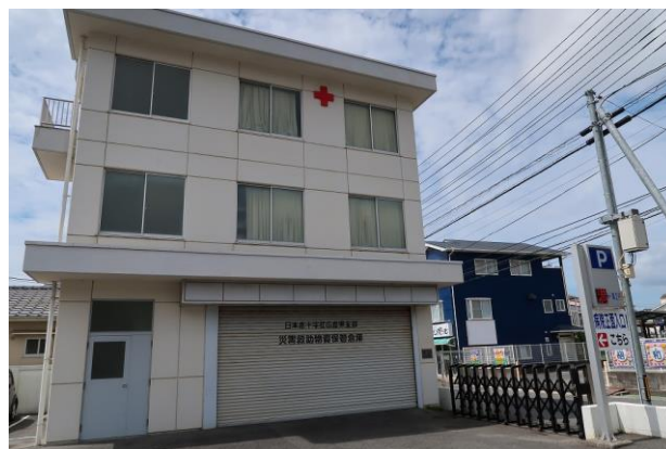
災害救助物資保管倉庫 (三原赤十字病院)