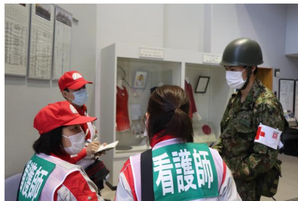
避難所にて自衛隊から被害状況を聴取（熊本県葦北郡芦北町）