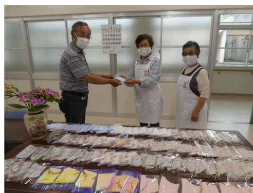
地区に配布する因島やすらぎ赤十字奉仕団