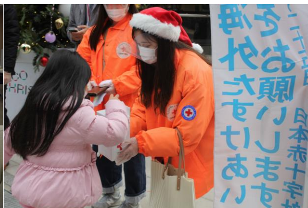
広島市内の街頭でNHK海外たすけあい募金を実施