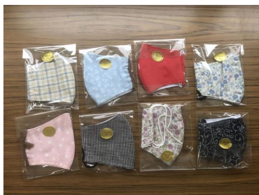
製作された布マスク

令和2年度は、新型コロナウイルス感染症の感染拡大により活動が制限される中で奉仕団自ら布マスクの製作に取り組みました。製作したおよそ2,000枚のマスクは地域の保育園や地区の社会福祉協議会など一般の方へ配られました。