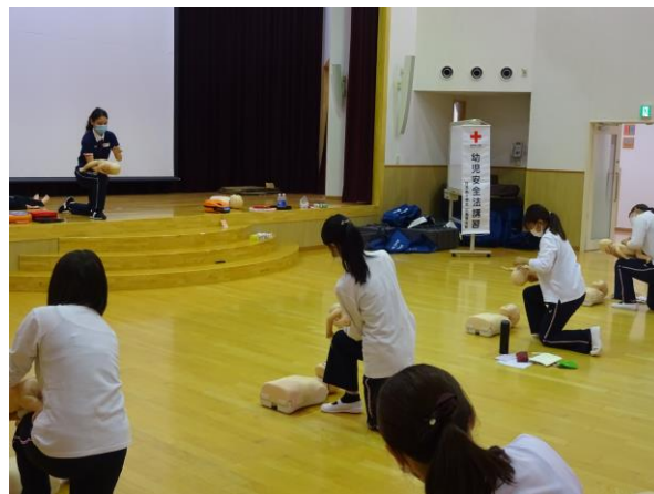
感染防止対策を講じながらの実技演習