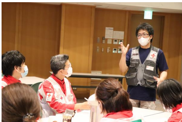
熊本県支部でのブリーフィング