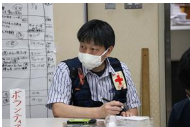
災害対策本部で活動する赤十字防災ボランティア

日本赤十字社本社が1月16日に開催した赤十字防災ボランティアリーダー養成研修に参加し、赤十字防災ボランティアリーダー1名を養成しました。