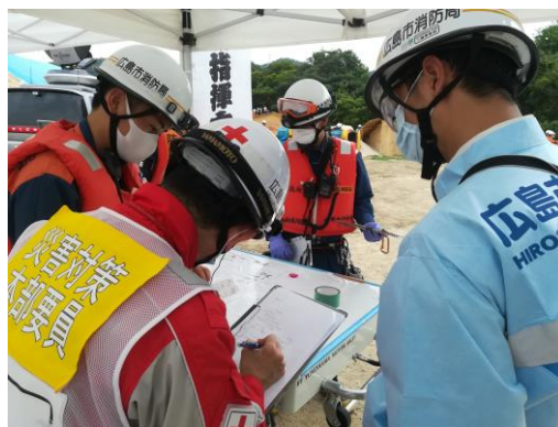
本部での消防署との情報共有