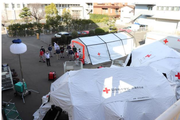
支部が所有するテント群