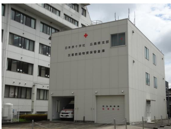
災害救助物資保管倉庫 (庄原赤十字病院)