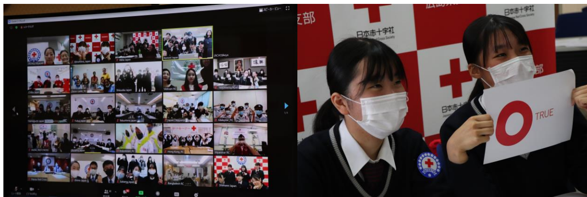
青少年赤十字国際交流集會の様子