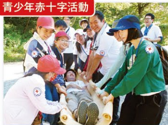
青少年赤十字活動