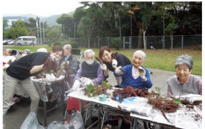
各ユニット毎で行う余暇活動も入居者の楽しみの1つです！職員も一緒に楽しそう。

錦江園では入居者を8つの小集団（ユニット）に分け、「なじみの関係と家庭的・個別的なケア」を心掛けて日々サポートにあたっています。お部屋については全部屋完全個室とし、入居者個人のプライバシーが保障される「個室」と他の入居者や介護スタッフと交流する「居間」を併存しています。併存させることで入居者自身区別ができ、ストレス軽減につながります。また、入居されるまで使用していた家具等を持ち込むことで、生活の継続が図られ、環境変化による心理的ショックを和らげようとする意図があります。