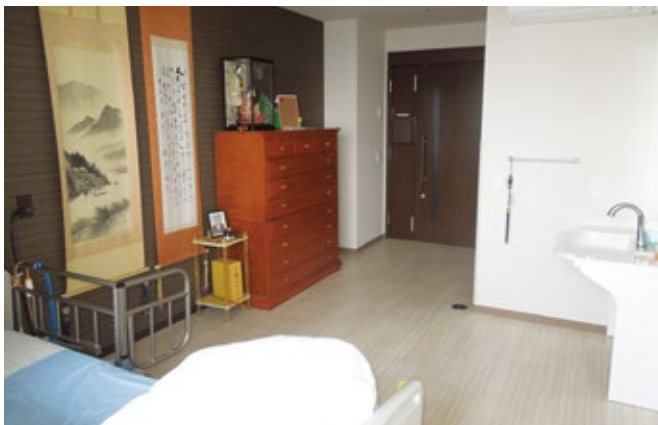
お部屋は洗面・お手洗い・冷暖房完備！