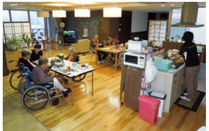
食卓を囲む日常のありふれた光景の中で過ごすことができます！