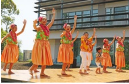
ボランティアレクリエーション