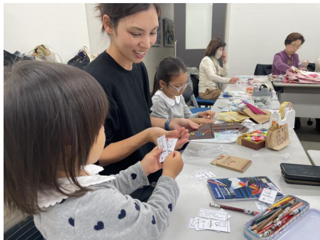
( 活動の様子 )