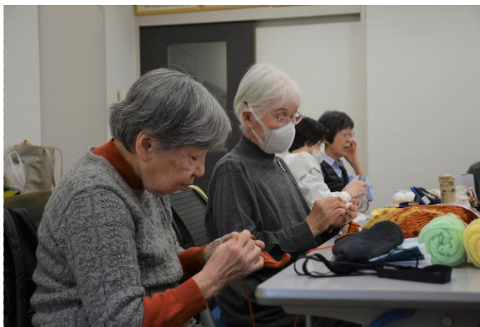
( 活動中の様子 )