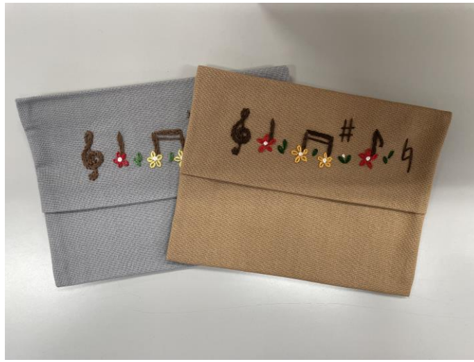
● ポケットティッシュケース