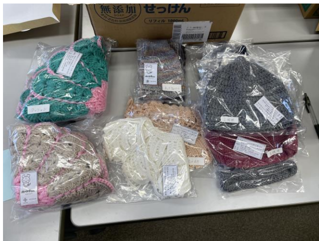
( 製作品 )