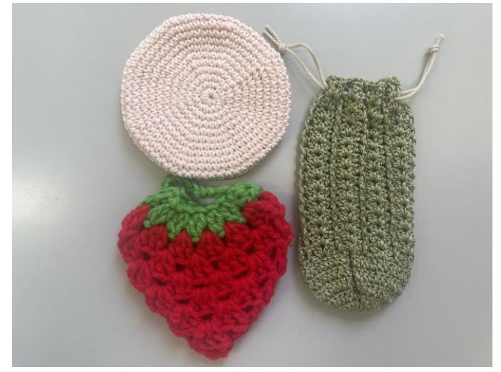
● コースター・巾着