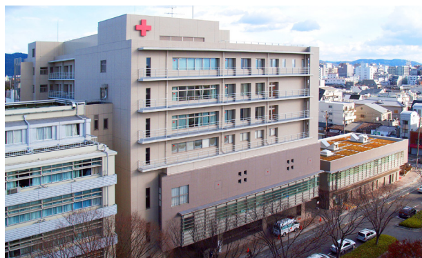
京都第二赤十字病院