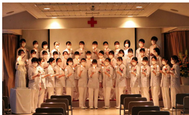
京都第二赤十字看護専門学校（宣誓式）