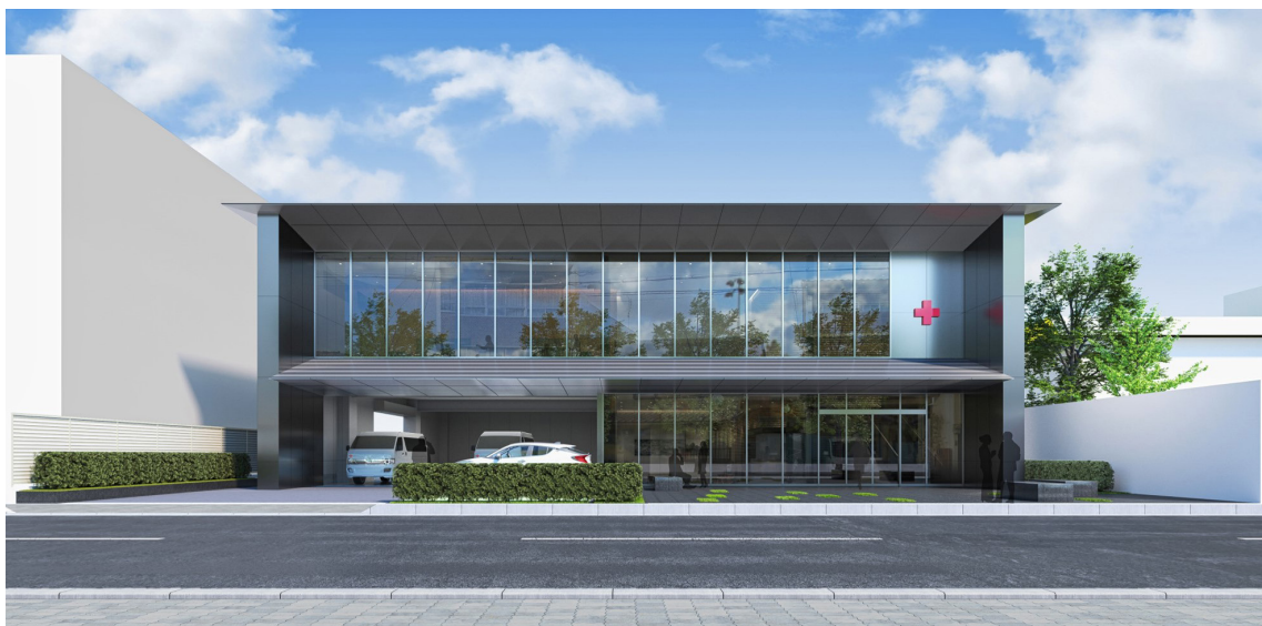
支部庁舎 正面イメージ

既存建物の解体撤去工事も終了し、令和4年10月より新築工事に入っており、令和5年10月の竣工を目指して、今後も着実に整備を進めてまいります。