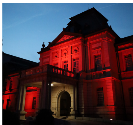
「レッドライトアップ」プロジェクト (京都府庁旧本館)

さらに、世界各地で紛争や災害、病気などで苦しむ多くの人々を支援するため、「海外たすけあい」募金キャンペーンを実施するとともに、阪神・淡路大震災、東日本大震災、熊本地震など、過去の災害の教訓を忘れることなく、「風化防止」や「復興支援」にとどまらず、未来に目を向けた「防災・減災の備え」を訴求し、将来の災害に対する意識の向上を図る「ACTION！ 防災・減災」に取り組めます。