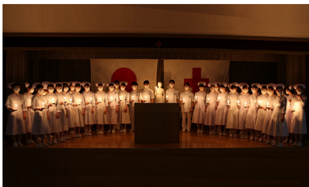
京都第一赤十字看護専門学校（戴帽式）