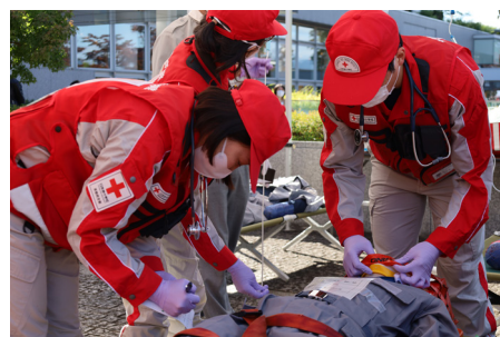
救護訓練に参加する救護班

「自助・共助」の取組を推進するため、京都府内の地区・分区と連携し、新型コロナウイルス感染症に対応した新カリキュラムで、「講義：災害への備え」や「災害図上訓練（DIG） ※1 」、「災害エスノグラフィー ※2 」等、防災・減災に役立つセミナーを開催します。