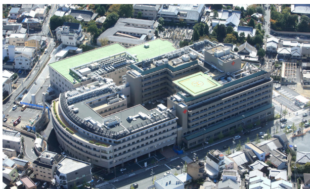
京都第一赤十字病院