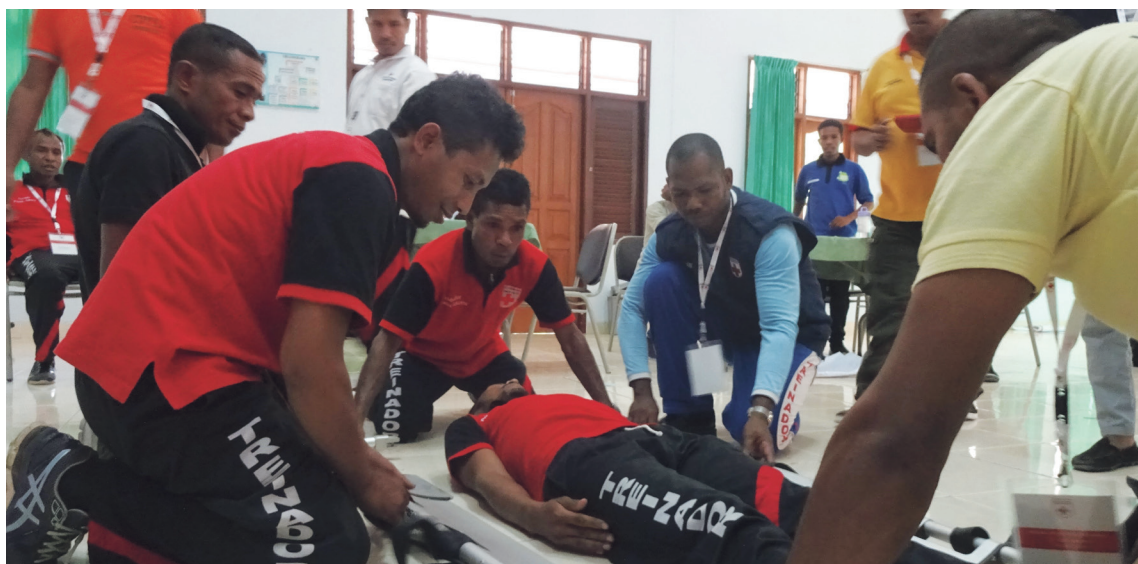
救急法普及支援事業