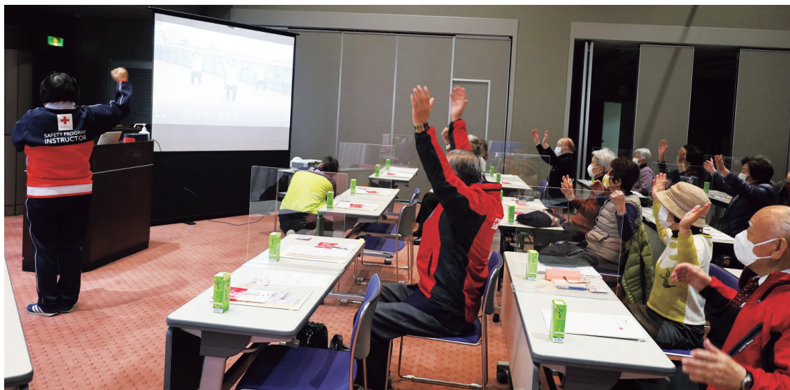
赤十字奉仕団による研修会

赤十字奉仕団員として多くの皆様の参加を得ることは、赤十字事業の発展に繋がるものであるため、今後も引き続き、地域奉仕団、青年及び特殊奉仕団の組織の充実と強化を図り、赤十字思想の普及や支援者の増強に関する奉仕団活動等の促進に努めます。