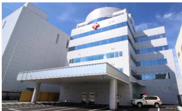
京都府赤十字血液センター

現在、超少子高齢化社会の進行や、若年者の献血離れに加え、コロナ禍による企業のテレワークや学校でのリモート授業の促進により、血液確保が大変困難となってきております。献血会場でのコロナ感染防止対策を徹底するとともに、献血 Web 会員サービス（ラブラッド）の会員登録を推進して献血予約を拡充し、府民の皆様へ献血にご協力いただきやすい環境づくりに取り組み、輸血用血液製剤が安定的に供給される体制を維持するよう努めます。