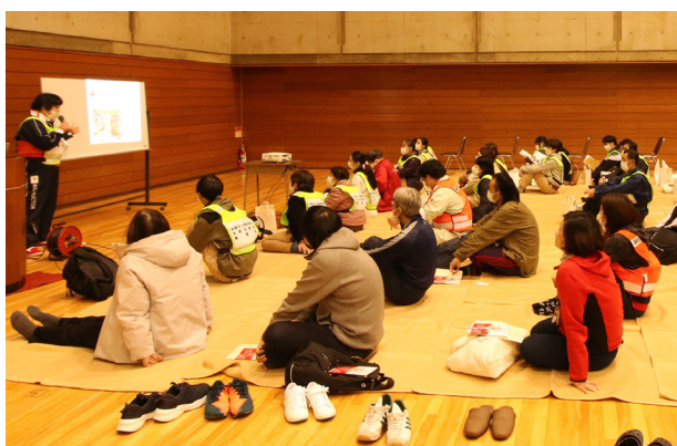
健康生活支援講習（災害時高齢者生活支援）