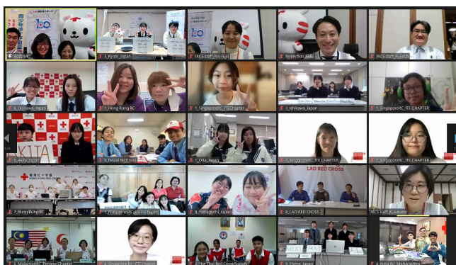
青少年赤十字メンバーによる国際交流事業