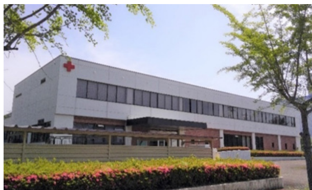
京都府赤十字血液センター 福知山出張所