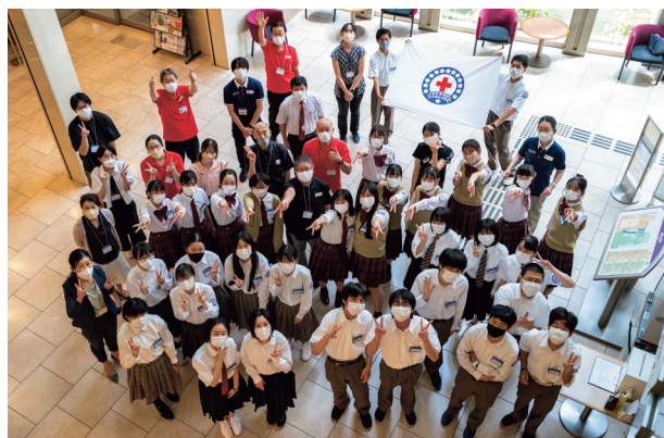
リーダーシップ・トレーニング・センター（高校生の部）