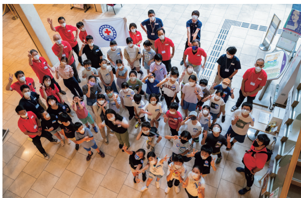
リーダーシップ・トレーニング・センター（小学生の部）