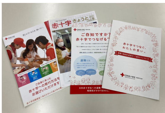
京都府支部の広報資料

遺贈に関するパンフレットの配布や、地元金融機関との連携等により、支部に対する遺贈・相続財産寄付の周知拡大に努めます。