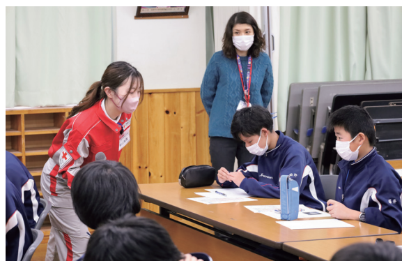
防災教育プログラム