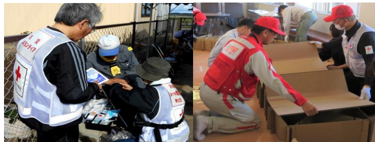
令和元年台風19号災害時の赤十字防災ボランティアの活動