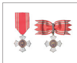
金色有功章(個人:勳章式) (左:男性・右:女性)