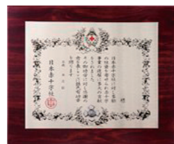
銀色有功章 (個人・法人:橋式)