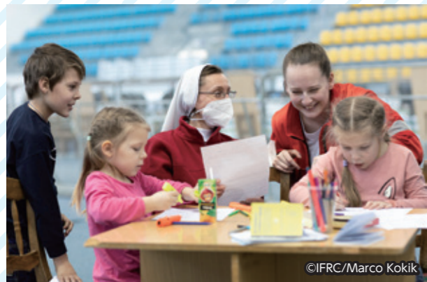
スロバキアの「チャイルド・フレンドリー・スペース」で遊ぶウクライナ避難民の子どもたちと赤十字ボランティア