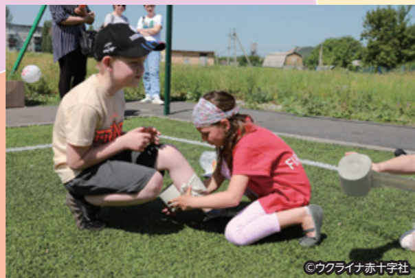
応急手当の講習を受ける子どもたち