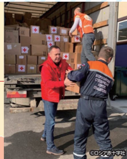
国境近くで避難民に救援物資を配布するロシアの赤十字ボランティア