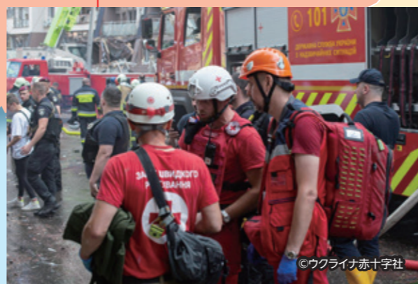
首都キーウ周辺で救援活動を行うウクライナ赤十字社の職員