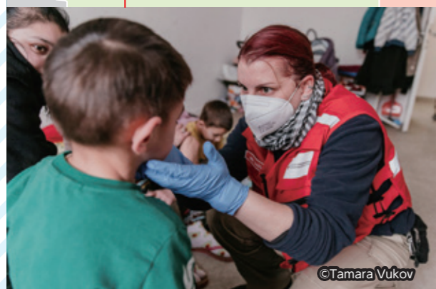
ウクライナから避難してきた人に保健医療を提供するハンガリー赤十字社の医療ボランティア