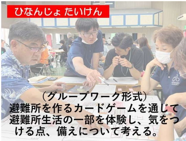
ひなんじょたいけん

日本赤十字社では、平時より「いざ」という時の「備え」のための「赤十字防災セミナー」に力を入れています。セミナープログラムの一部をご紹介します。