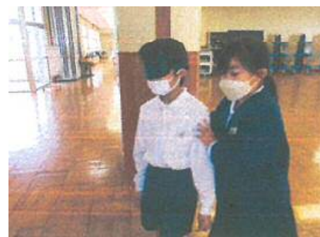
長久小学校：障がい体験学習