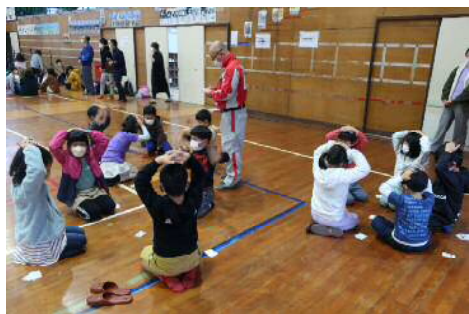
荘原コミュニティセンター