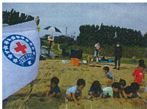
一の谷保育園：食育活動