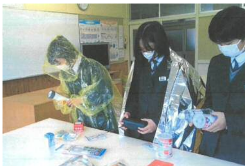
海潮中学校：防災学習