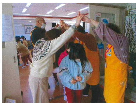
川合小学校：お年寄りとの交流