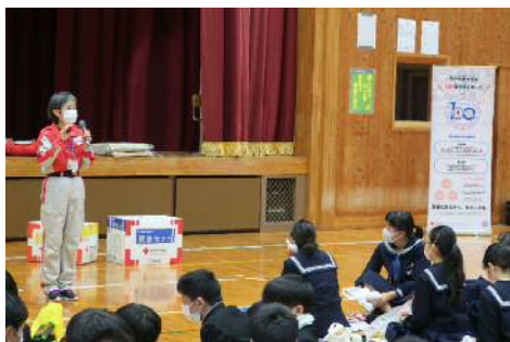
安来市立第3中学校

日本赤十字社島根県支部では、マスクの着用、手指消毒、室内の換気、人と人との間隔を取るなどの感染症対策を取りながら出前授業を実施しております。詳細につきましては島根県支部までお気軽にお問い合わせください。