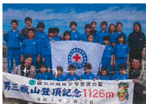
志学小学校：宿泊学習（清掃・野外活動等）