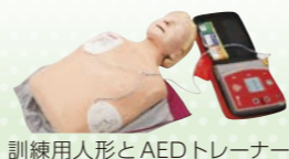
訓練用AEDとAEDトレーナー

講習で使う人形や、訓練用AEDなどの教材は、自治会などを通じて皆さまからお寄せいただく 日赤会費・寄付金(活動資金) に支えられています。引き続き、ご協力をお願いいたします。