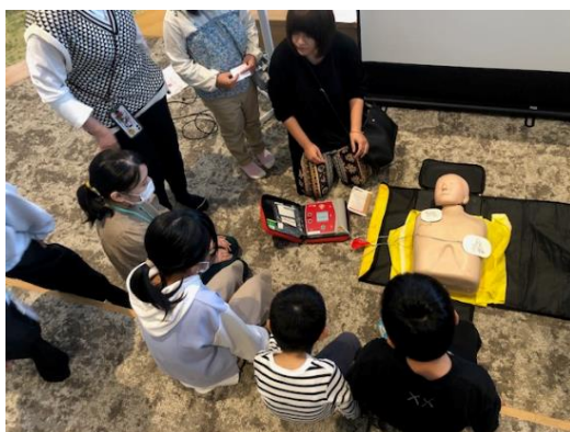
小学生への心肺蘇生啓発活動

また、新たに活動に取り組む青年赤十字奉仕団、学生赤十字奉仕団の結成を推進します。