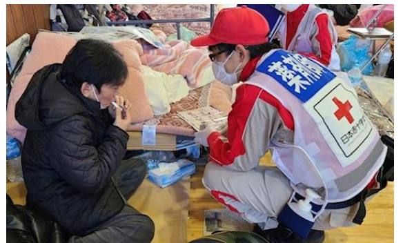
能登半島地震の避難所で活動する当支部の常備救護班

また、和歌山県と災害派遣医療チーム（DMAT） (※1) の派遣協定を締結しており、県からの派遣要請に備えています。現在、当支部に5チーム（1チームあたりの編成は、医師1名、看護師3名、業務調整員1名）、25名の隊員が登録されています。