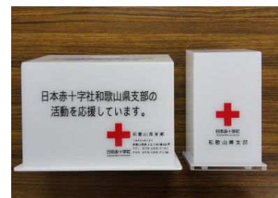
設置場所に合わせた2種の善意箱