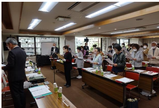
会議の冒頭に行う奉仕団信条の唱和

赤十字事業や奉仕団活動の連携と情報共有を図るため、地域・特殊奉仕団の委員長を対象として、委員長会議を年2回開催します。