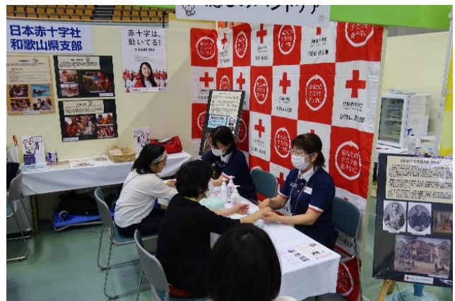
パネル展示等による赤十字活動の紹介

公共団体や企業などのイベントに参加させていただき、赤十字活動パネルの展示など、会場に来られた多くの方々へ向けた赤十字事業と活動資金募集のPRに努めます。