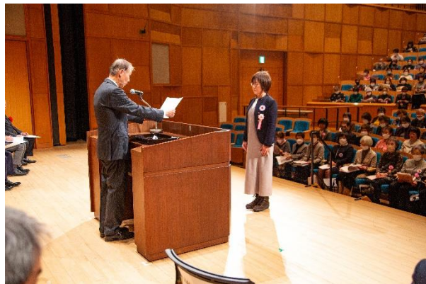
長年の功労が顕著な奉仕活動に対する有功章の贈呈