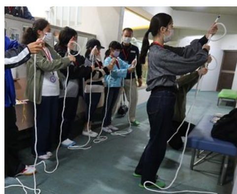
トレーニングセンターの運営支援