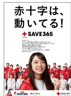
2023 年度「広報ポスター」

本社が作成した赤十字ポスターやリーフレットを地区区分区に配付し、掲示していただくようお願いして、赤十字のPRに努めます。