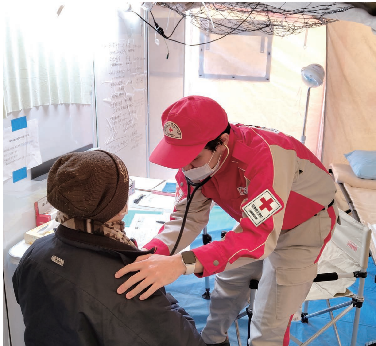
能登半島地震災害において医療救護活動を行う山梨県支部救護班