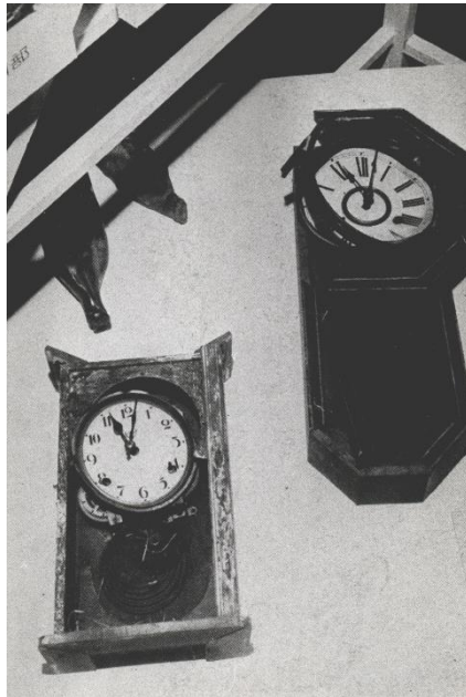
原爆投下時刻で止まったままの時計

今から79年前の1945年8月9日午前11時2分、長崎に原子爆弾が投下されました。同月6日に広島に人類史上初めて原爆が投下されてから、わずか3日後のことです。この一発の原爆で、約7万4000人の命が奪われ、重軽傷者も含めて約14万9000人が被害に遭う事態となりました。79年経った現在も多くの被爆者が原爆の後遺症に苦しみ、また精神的な不安に襲われ、広島や長崎にある赤十字病院などで治療を受けています。代表的な症状である白血病等の治療のためには輸血が不可欠です。