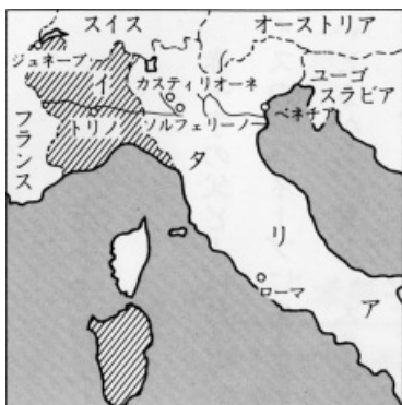
イタリアの地図（ななめの線の部分が、当時のサルジニア王国。）

ひびきわたった。いたる所で血みどろの戦いがくり返され、多くの兵士がきずつき、たおれた。そのうえ、夕方からは、暴風雨になり、戦いにつかれ切った兵士たちをいっそう苦しめた。やがて、連合軍がオーストリア軍の強固な中央じん地をうちやぶると、オーストリア軍は、力つきてたいきやくを始めた。