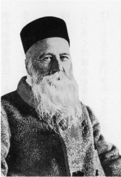
アンリー・デュナン

一九一〇年十月三十日、美しい湖にのぞんだハイデンで、アンリー・デュナンは、八十二才のしょうがいをとじた。